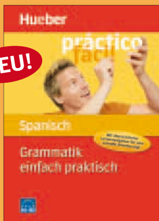
Grammatik einfach praktisch Spanisch 240 Seiten € 14,95 (D) / € 15,40 (A) / CHF 26,80 • ISBN 978-3-19-009904-7

Die Grammatik einfach praktisch ist eine Nachschlage- und Lerngrammatik mit Übungen und eignet sich sowohl als Ergänzung zum Kurs als auch zum Selbstlernen. Sie zeichnet sich aus durch eine leichte Einführung in die grammatischen Themen und eine besonders verständliche Formulierung der Regeln.