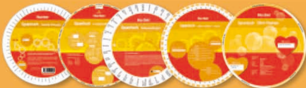
Hueber Wheels Spanisch je € 3,95 (D) / € 3,95 (A) / CHF 7,60 Δ

Die Hueber Wheels sind ideal für das schnelle Sprachtraining unterwegs oder zwischendurch. Einfach die mittlere Scheibe drehen – schon werden Redewendungen, unregelmäßige Verben oder falsche Freunde angezeigt.