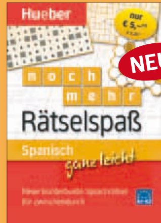
Spanisch ganz leicht noch mehr Rätselspaß 224 Seiten € 5,- (D) / € 5,20 (A) / CHF 9,40 ISBN 978-3-19-359499-0

Spanisch ganz leicht noch mehr Rätselspaß bietet 180 neue kurzweilige Kreuzworträtsel (z. B. Schweden-, Schnecken- und Puzzlerätsel). Die Lösungen stehen auf der jeweiligen Blattrückseite zur direkten Kontrolle. Die einzelnen Rätselseiten sind heraustrennbar.